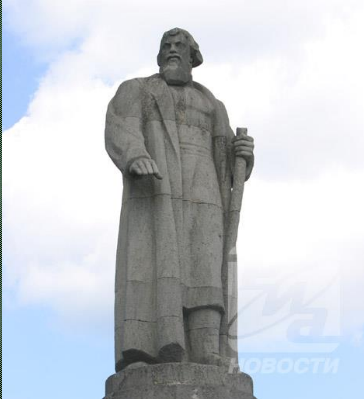
Памятник Ивану Сусанину в Костроме Скульптор – Н. Лавинский