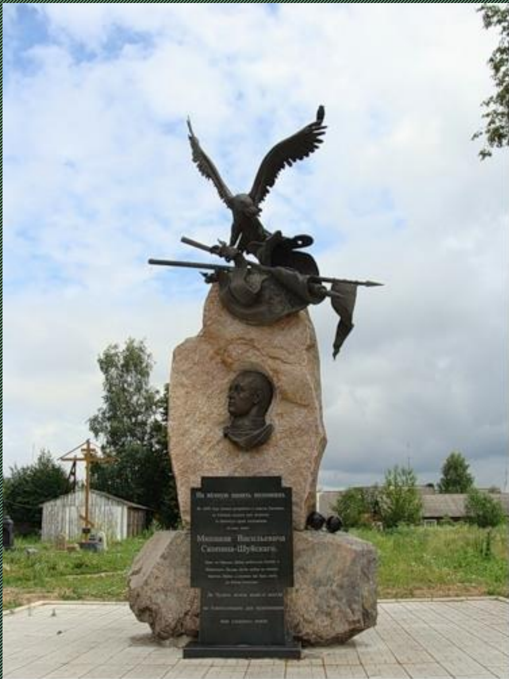
Памятник М. В. Скопину- Шуйскому в г. Калязин Тверской области Скульпторы Антонов и Комлев