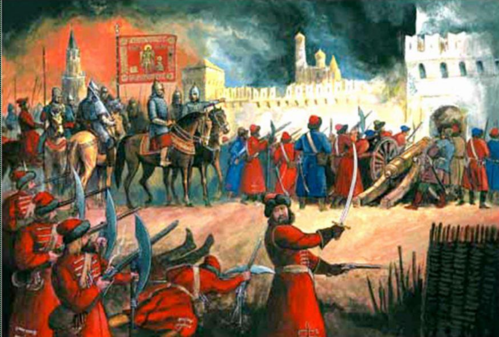
Минин и Пожарский у стен московского кремля. Событие 1612 года.