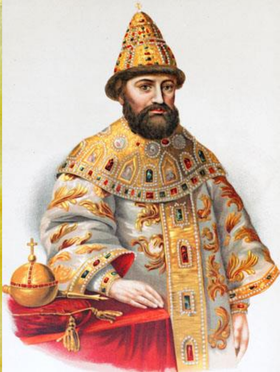
Михаил Фёдорович Романов