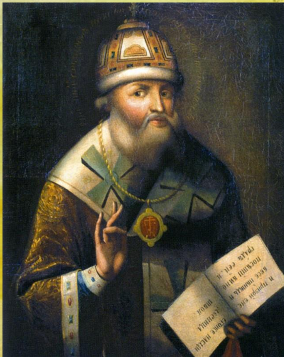
Фёдор Романов- Патриарх Филарет