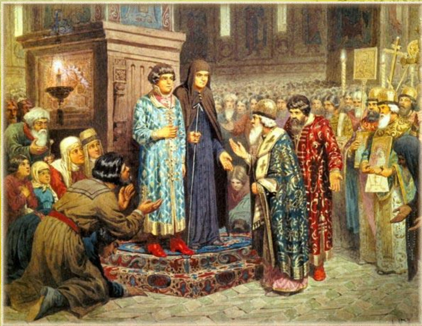
Картина А. Кившенко «Избрание Михаила Фёдоровича Романова на царство»