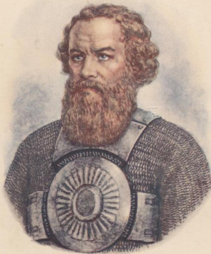
К озьма М инин