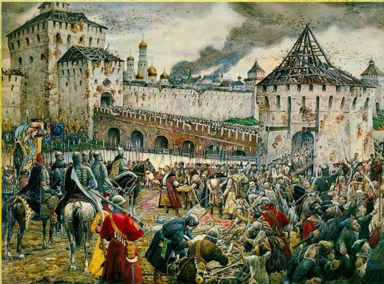
Картина Лиснер Эрнста «Изгнание поляков из Кремля»